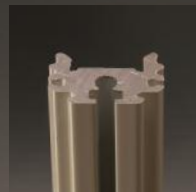
Laqué epoxy blanc PR0241

Profilé en aluminium extrudé conçu pour les rubans FORCELIGHT et SMARTLIGHT.