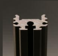
Anodisé noir PR0231